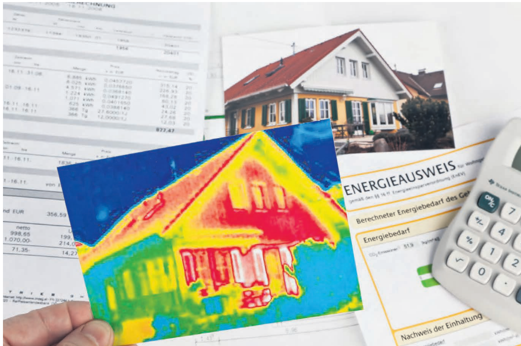
800 Experten. Der Gebäudeenergieausweis ermöglicht es, richtige Massnahmen zu treffen und damit die Energieeffizienz in Gebäuden markant zu steigern.

Der Gebäudeenergieausweis ist jetzt noch benutzerfreundlicher und detaillierter